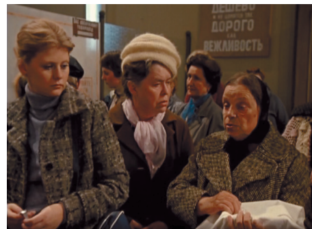
Кадр из кинофильма «Карнавал» 1981г. Сцена в ломбарде была снята в Краснопресненском отделении Мосгорломбарда

«Я часто вспоминаю 80-е годы... С одной стороны, про Москву было слышно на весь мир: сперва Олимпиада, потом кино наше везде показывали (фильм «Карнавал», «Москва слезам не верит», получивший Оскар в 1981 году. Примечание редакции). А с другой, — пустые полки на прилавках магазинов, денег тоже не сказать чтобы достаточно. Перестройка тогда ещё не началась.