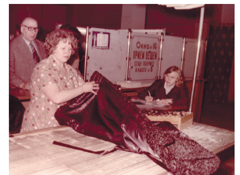
Прием изделий из меха. Мосгорломбард Холодильник. 1980г. (фотография из архива)

Про «холодильник» ещё хочу добавить, куда мы отдавали летом на хранение шубу, а в один год даже две — мою и мамину. К концу марта старались уже сдать, и вот, как сейчас помню, очереди даже были. И народа так много, я всё удивлялась, как у простых советских людей — такие хорошие шубы всех фасонов и мехов, да ещё и хранят они их специально, в холодильнике! Кто бы мог подумать (смеется). Пока в очереди постоишь, все модные тенденции, как внучка говорит «тренды» узнаешь. Однажды мне даже журнал Бурда дали почитать на время, я сперва забыла отдать, а потом он так у меня уже и остался. Подожду пока раритетом станет и принесу вам обратно (снова смеется).