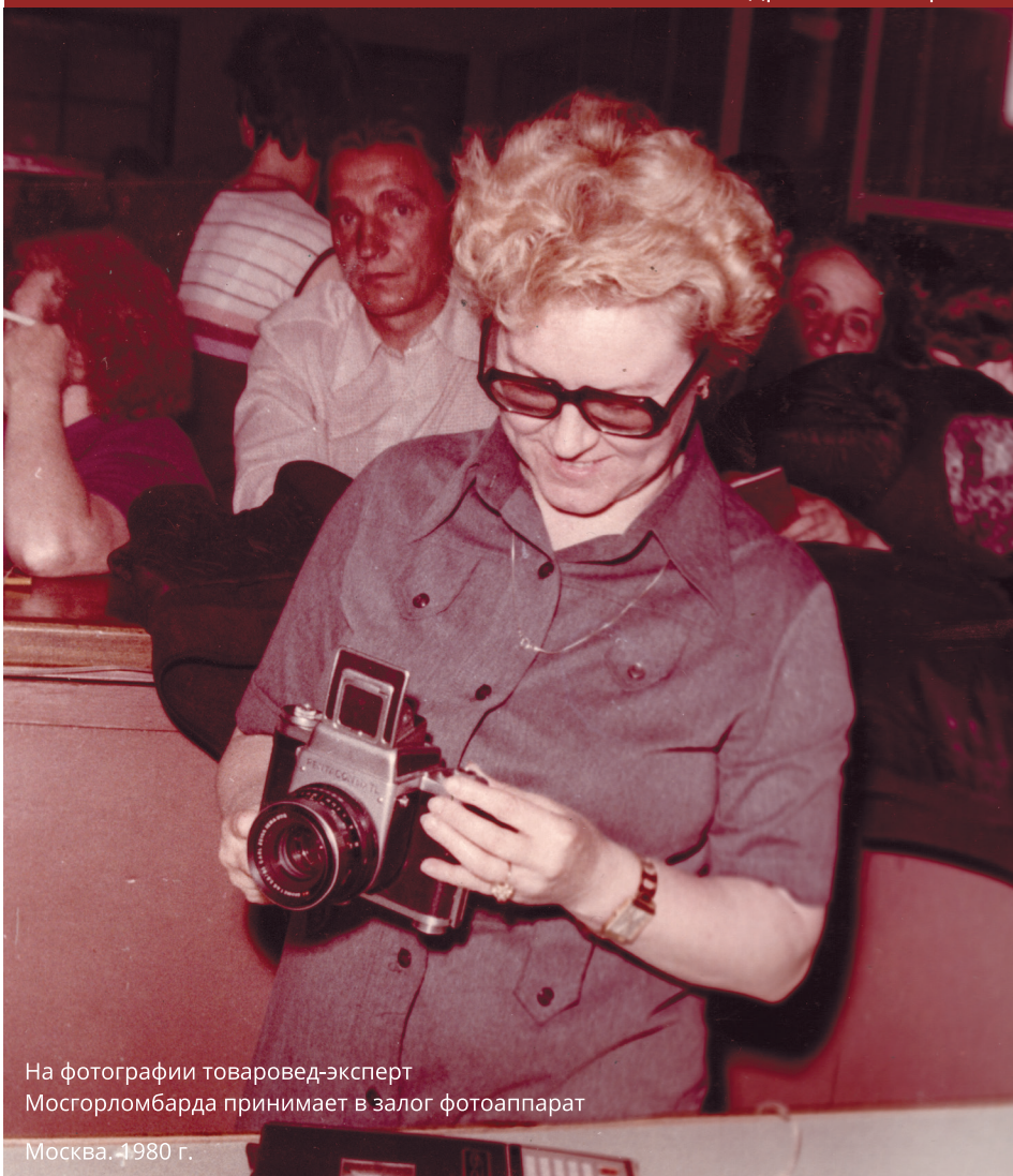
На фотографии товаровед-эксперт Мосгорломбарда принимает в залог фотоаппарат Москва. 1980 г.